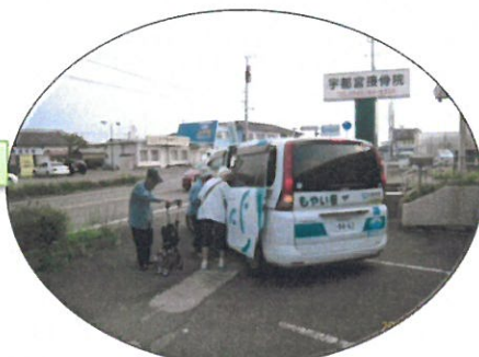
接骨院到着 (4 人-1 人=3 人)