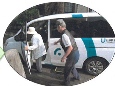
近所の人が医療機関へ (3 人+1 人=4 人)