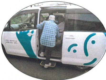
隣の人が医療機関へ (2 人+1 人=3 人)