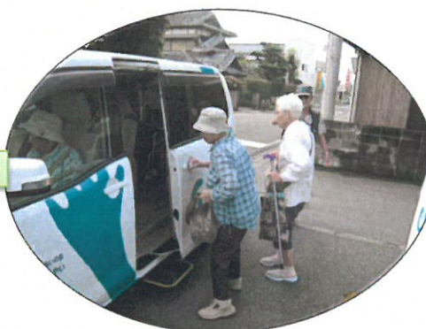
医療機関到着 (3 人-2 人=1 人)