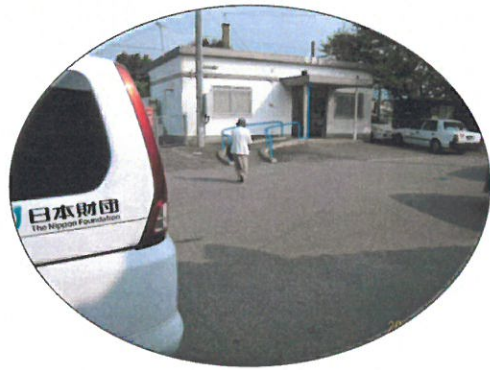
目的地、佐賀市内の方が 中原駅まで利用

「もやい号」は中原校区内運行ですが、JR を利用するため中原駅まで利用し、帰りは又中原駅から利用すれば、どこまでも行けます。