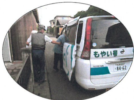
夫婦で整骨院、医療機関へ (2 人)