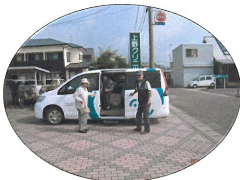
医療機関到着 (2 人-2 人=0 人)