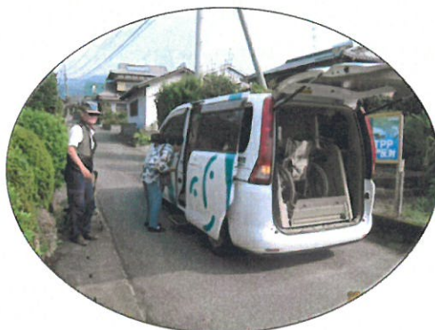
他地区の人が医療機関へ (1 人+1 人=2 人)